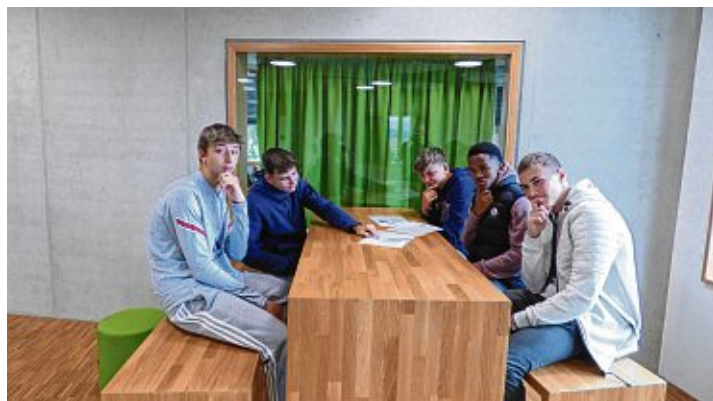
Beim Ballonspiel rauchten die Köpfe der 9a, denn die Aufgabe war nicht einfach.