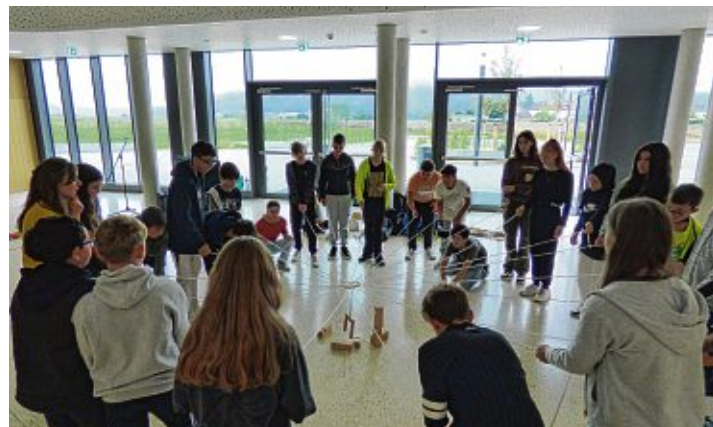
Beim Kranspiel war Teamwork gefragt.